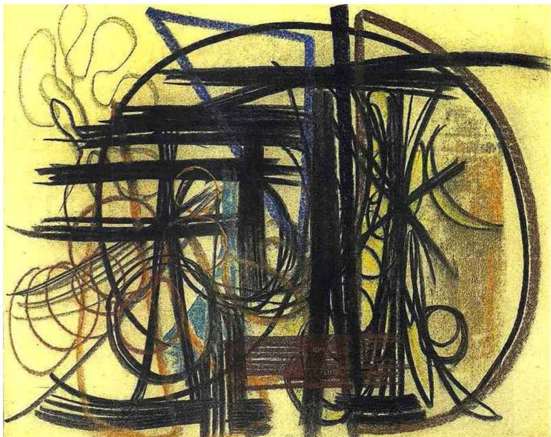
Ci-dessus, « Composition », 1947, de H. Hartung, galerie Applicat-Prazan (Paris). En bas, « Études de deux figures féminines debout, drapées », plume et encre, lavis de sanguine, de A. Bloemaert, Galerie Katrin Bellinger Kunsthandel.

Le succès du Salon du dessin a entraîné la naissance d'autres foires, de ventes et d'expositions en musées qui, en mars, font de Paris la capitale mondiale de cet art.