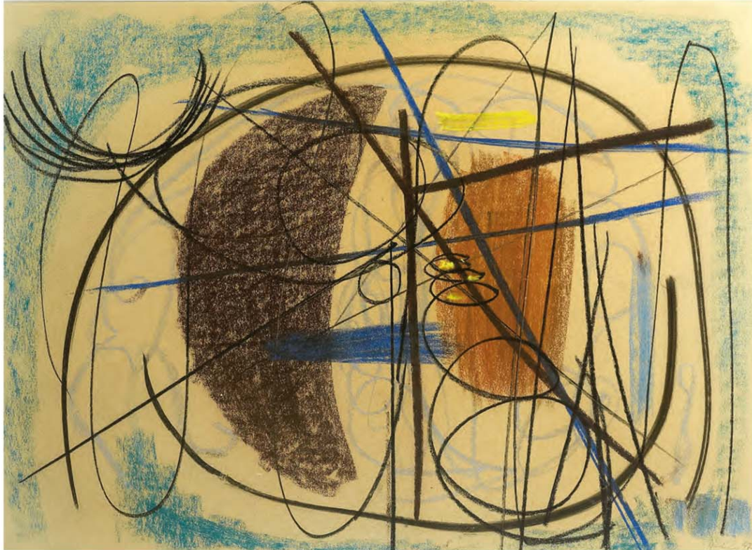
Hans Hartung , pastel, 1947

Périodicité : Mensuelle Diffusion : 40 000 Catégorie : Presse écrite