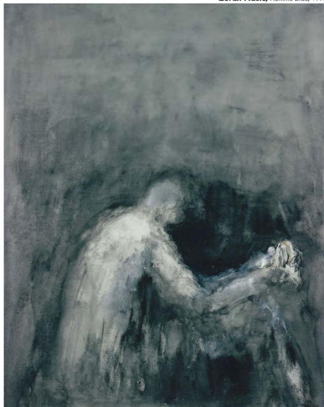
Zoran Music, Homme brisé , 1998