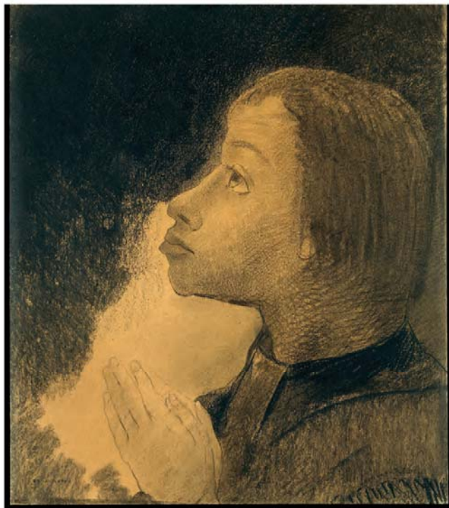
Odilon Redon, La prière , c. 1870-1875