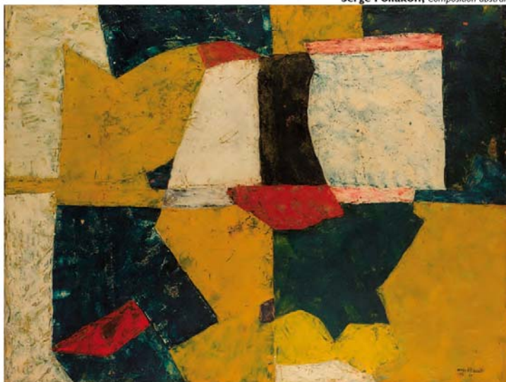
Serge Poliakoff, Composition abstraite