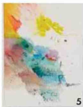
1. « Lunch Break » (1998), d'Art Spiegelman. 2. « Femme debout se couvrant le visage avec ses deux mains » (1911), d'Egon Schiele. 3. « Bearing » (2018), de Claire Morgan. 4. « Nous #1 » (2018), de Jérôme Zonder. 5. « Mid Air » (2018), de Friedrich Kunath. 6. « Enfants dans un pré » (1908), de Malevitch. 7. « Un Szlachcic de Pologne » (1913), de Tatline.