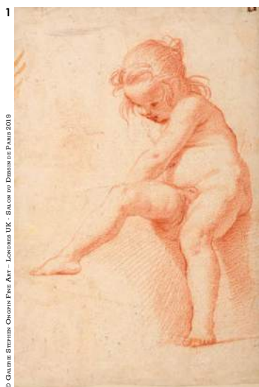
© Galerie Bismuth Orona Fine Art - Londres UK - Salon du Dessin de Paris 2019

Du 27 mars au 1 er avril 2019, la 28 ème édition du Salon du Dessin se tiendra sous la voûte du palais Brongniart, réunissant 39 galeries venues du monde entier, dont 4 marchands qui n'ont jamais participé à l'événement.