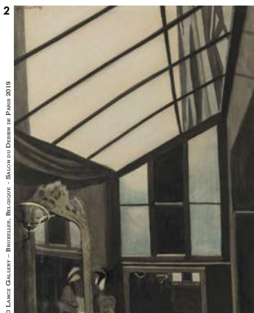
© Lucie Chaussy - Bruxelles Belgique - Salon du Dessin de Paris 2019

belles feuilles y est révélée au cours de la dernière semaine de mars. Durant ces 6 jours de convivialité que d'aucuns louent pour la qualité constante et la diversité des œuvres présentées, les conservateurs de musées, collectionneurs et amateurs de tout bord se pressent au cœur de la Ville Lumière afin de découvrir, en avant-première, les dernières trouvailles de marchands triés sur le volet.