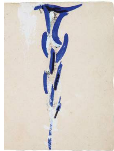
6 © GALERIE AB - PARIS - SALON DU Dessin de Paris 2019

14 èmes rencontres internationales du salon du dessin ayant pour thème «Le dessin et les arts du spectacle, Le geste et l'espace». De plus, cela fait déjà une décennie que les œuvres des trois lauréats de la collection de la Fondation Daniel et Florence Guerlain sont distinguées tandis que la maison Chaumet présente sa 2 ème exposition, «Dess(e)in de nature». Enfin, en préambule à sa réouverture fin 2019, le Musée Carnavalet est à l'honneur, révélant la richesse de sa collection de dessins autour de «Fêtes et spectacles à Paris». Sans oublier la passerelle sur l'extérieur via les institutions et musées avec La Semaine du dessin, parcours hors-murs qui offre aux visiteurs le privilège de participer à des visites inédites de cabinets d'art graphique. ■