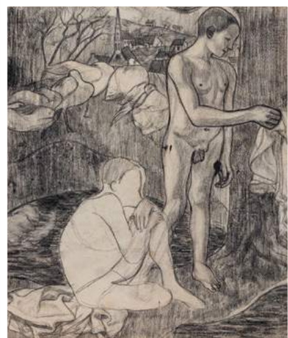
© Galerie Talabardon & Gautier - Paris - Salon du Dessin de Paris 2019

C'est ce qui est arrivé avec le portrait du Comte Molé de Ingres vendu à Saint-Valéry-en-Caux le 1er janvier dernier. Le prix atteint, 1 089 000€, s'explique par la multiplicité de facteurs positifs entourant ce dessin: l'artiste, Ingres, considéré comme le plus grand portraitiste du XIX ème siècle, le modèle, le comte Molé, personnage important du règne de Louis-Philippe, les dimensions de la feuille qui font de ce portrait une grande effigie assez rare pour l'artiste, l'état de conservation qui donne à la technique utilisée une grande force notamment dans l'utilisation de la pierre noire. La concordance des éléments constitutifs de ce portrait en ont fait une œuvre rare et très appréciée dont le prix s'est justement envolé au moment de sa mise en vente le 1 er janvier dernier.