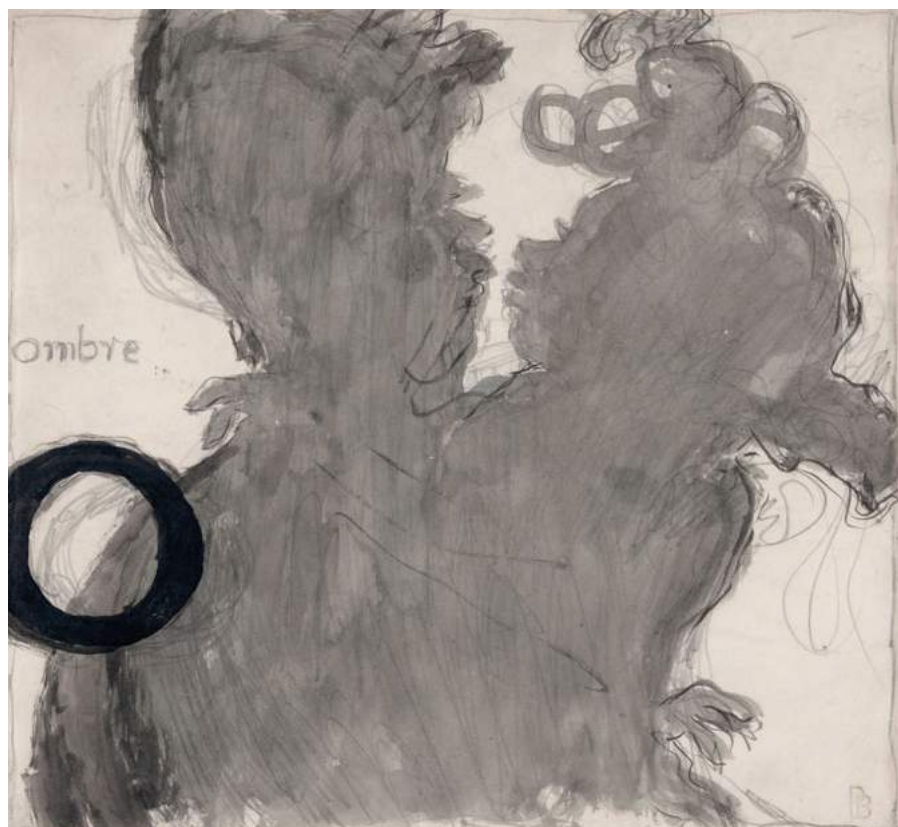
© Jiro Newhouse Gallery - New York, USA - Salon du Dessin de Paris 2019