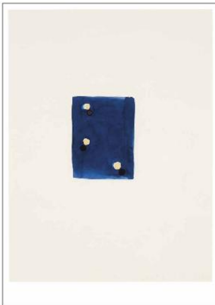
Juan Uslé, Lunada , 1995, aquarelle sur papier, 30,5 x 22,9 cm.

© Juan Uslé / Courtesy Galerie Lelong & Co