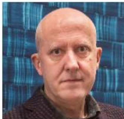
Juan Uslé.

Le déroulement du vote à distance est aussi un modèle d'adaptation pour les prix artistiques dans un contexte difficile. « Nous ne pouvions pas